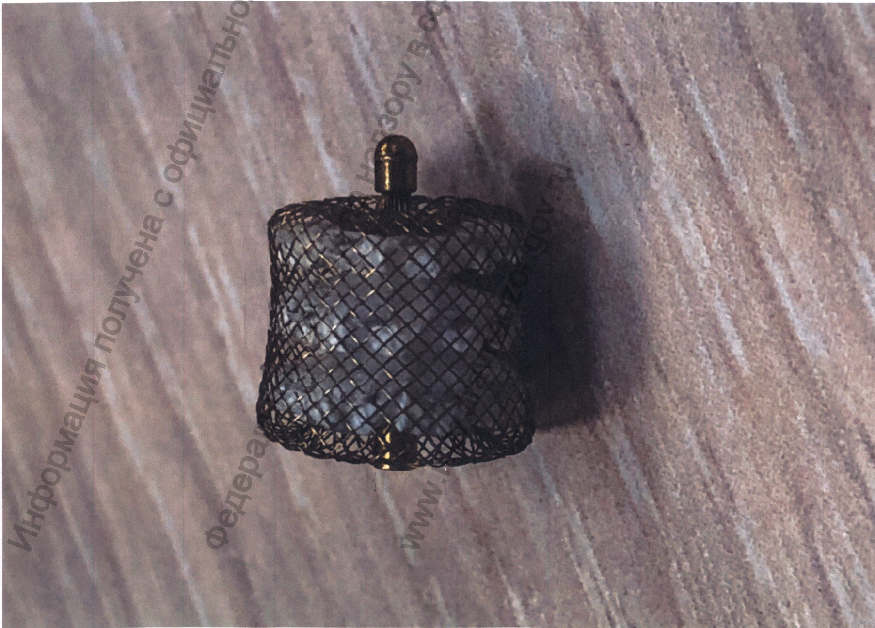
Общий вид имплантата