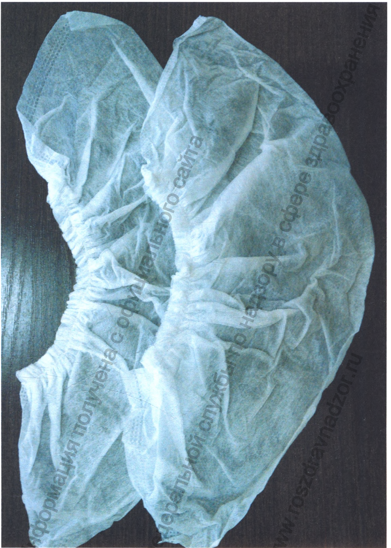
Общий вид медицинского изделия: Бахилы медицинские одноразовые по ТУ 32.50.50-003-70834095-2019, вид СТАНДАРТ(С), артикул МСП20С/125, цвет белый