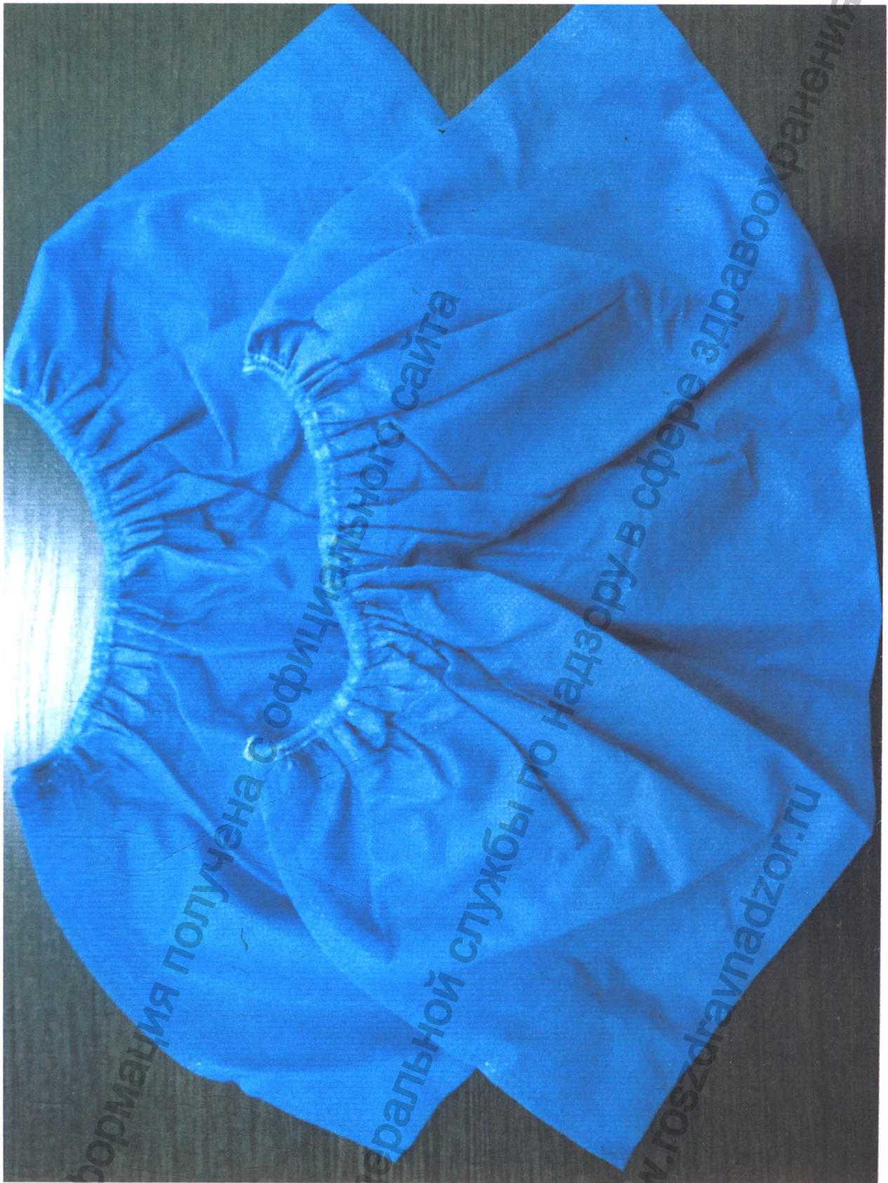
Общий вид медицинского изделия: Бахилы медицинские одноразовые по ТУ 32.50.50-003-70834095-2019, вид ЭКСТРА(С), артикул МСП42С/145, цвет голубой