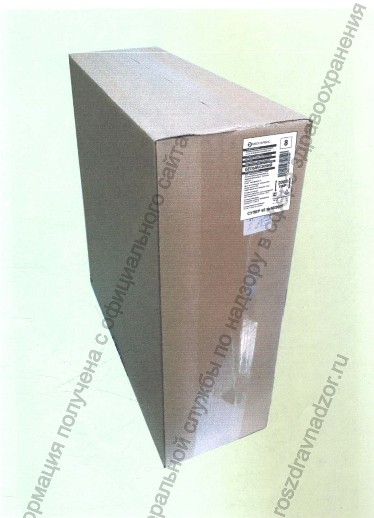
Общий вид транспортной упаковки медицинского изделия: Бахилы медицинские одноразовые по ТУ 32.50.50-003-70834095-2019.