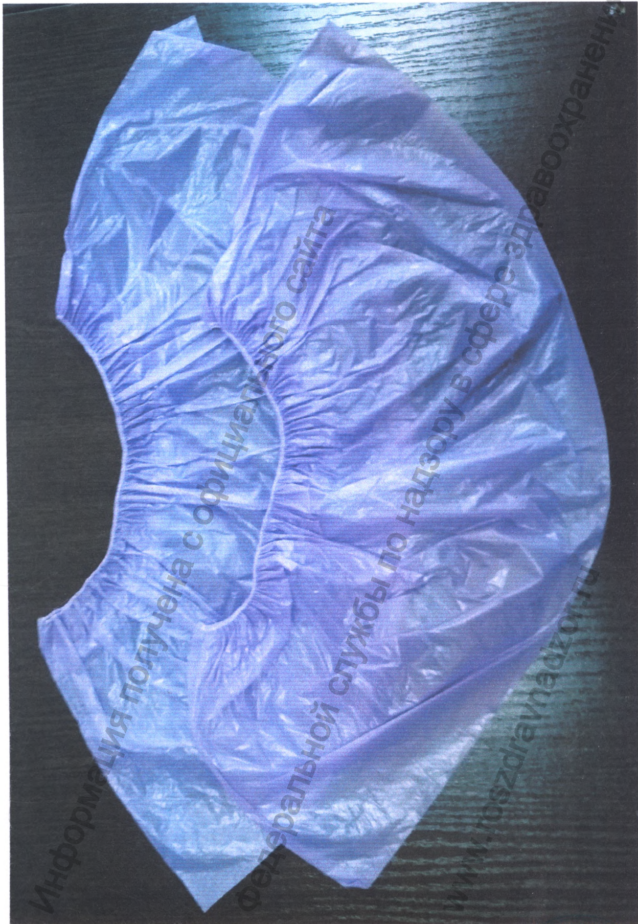
Общий вид медицинского изделия: Бахилы медицинские одноразовые по ТУ 32.50.50-003-70834095-2019, вид ЭКСТРА, артикул МСП30/33, цвет фиолетовый

Регистрация МИ в Росздравнадзоре www.nevacert.ru | info@nevacert.ru