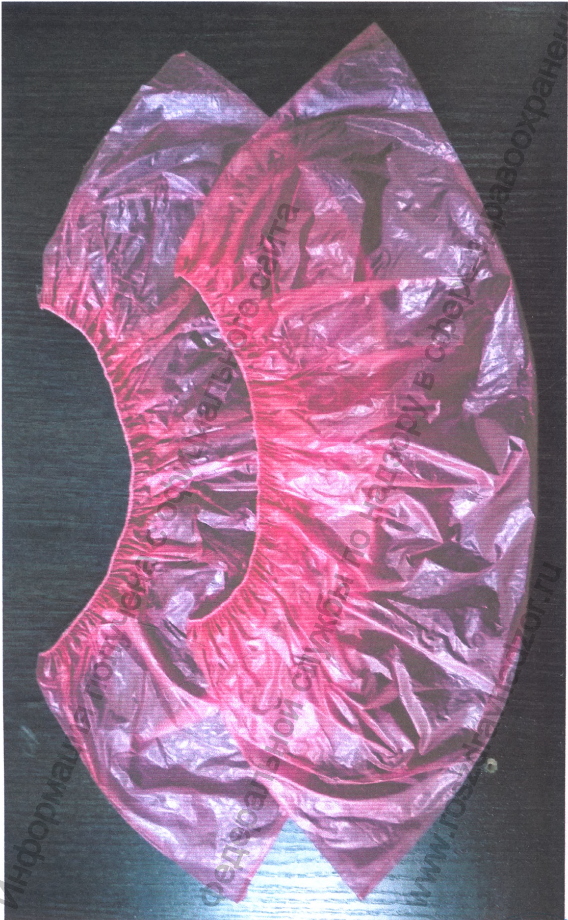
Общий вид медицинского изделия: Бахилы медицинские одноразовые по ТУ 32.50.50-003-70834095-2019, вид ЭКСТРА, артикул МСП30/35, цвет красный

Регистрация МИ в Росздравнадзоре www.nevacert.ru | info@nevacert.ru