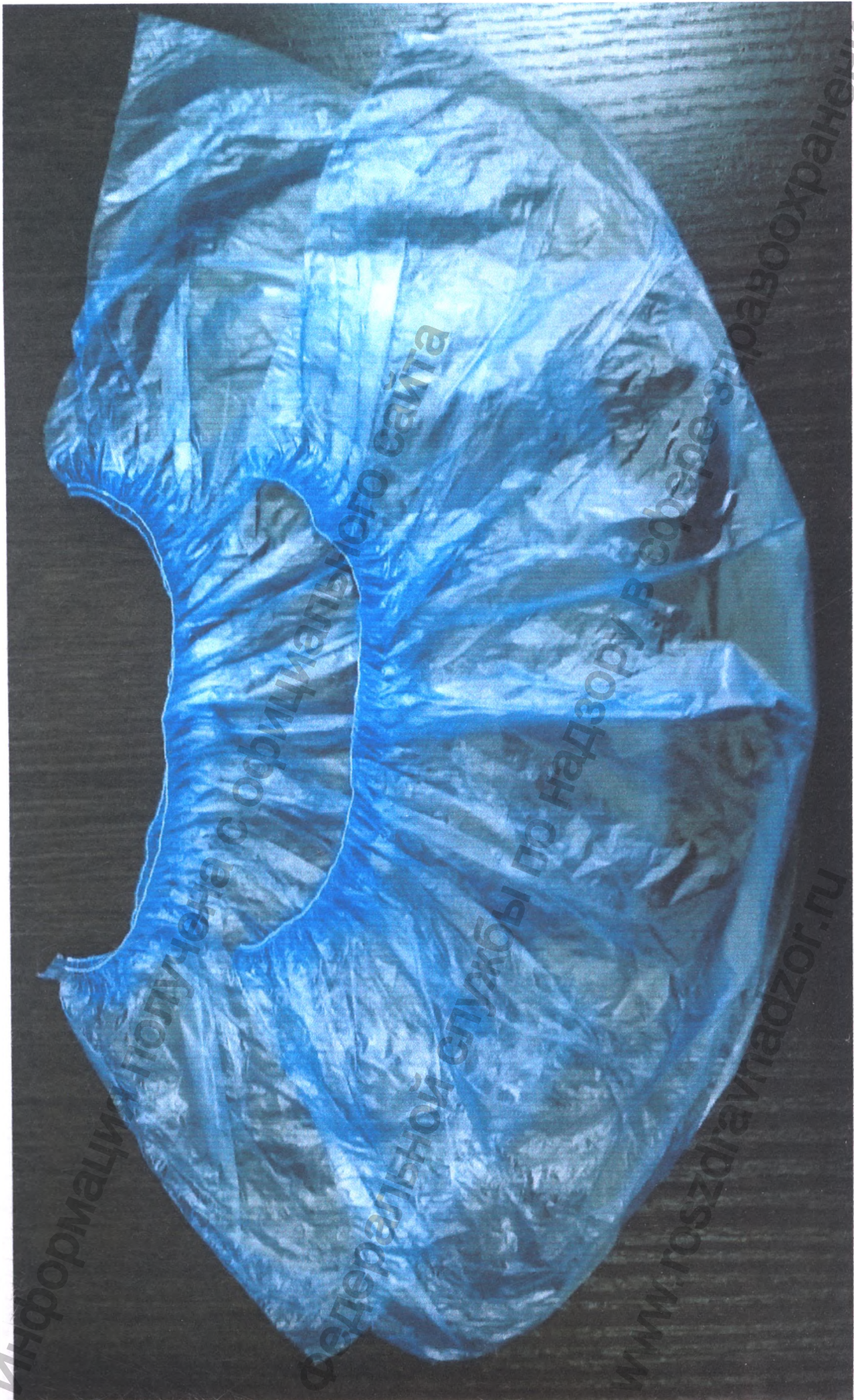
Общий вид медицинского изделия: Бахилы медицинские одноразовые по ТУ 32.50.50-003-70834095-2019, вид Лайт, артикул МСП14/1, цвет синий

Регистрация МИ в Росздравнадзоре www.nevacert.ru | info@nevacert.ru