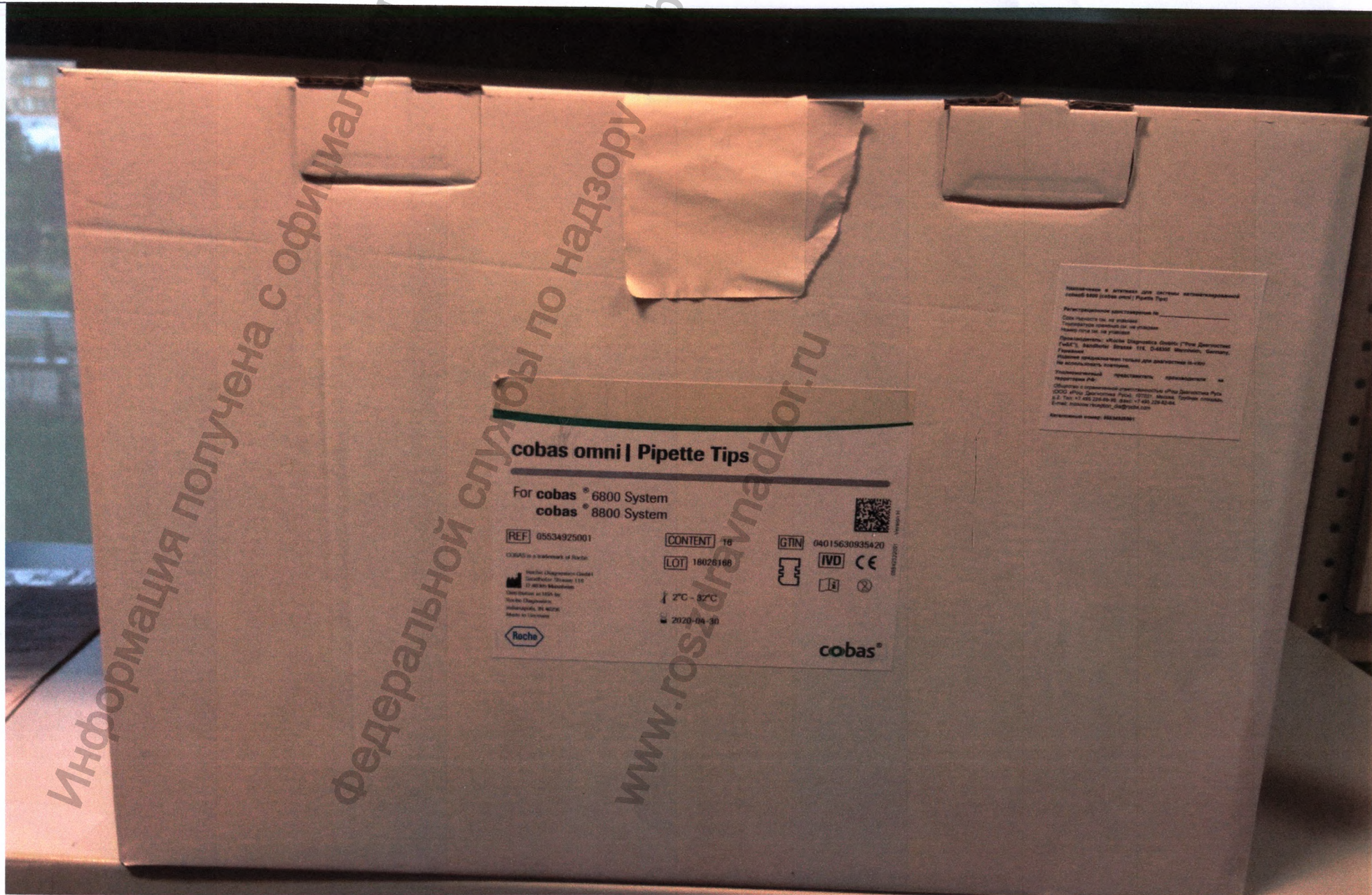
Рис.1.1 Наконечники в штативах для системы автоматизированной cobas® 6800 (cobas omni | Pipette Tips)