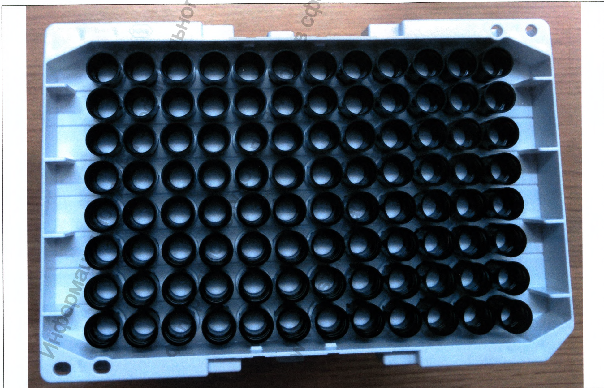
Рис.1.3 Наконечники в штативах для системы автоматизированной cobas® 6800 (cobas omni | Pipette Tips)