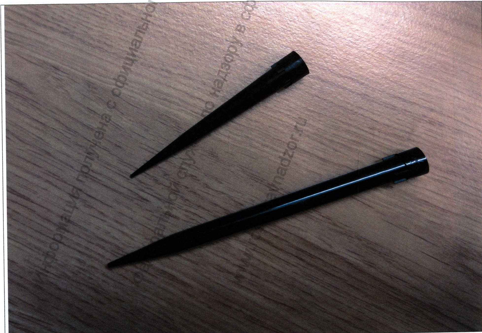
Рис. 1.4 Наконечники в штативах для системы автоматизированной cobas® 6800 (cobas omni | Pipette Tips)

Регистрация МИ в Росздравнадзоре www.nevacert.ru | info@nevacert.ru