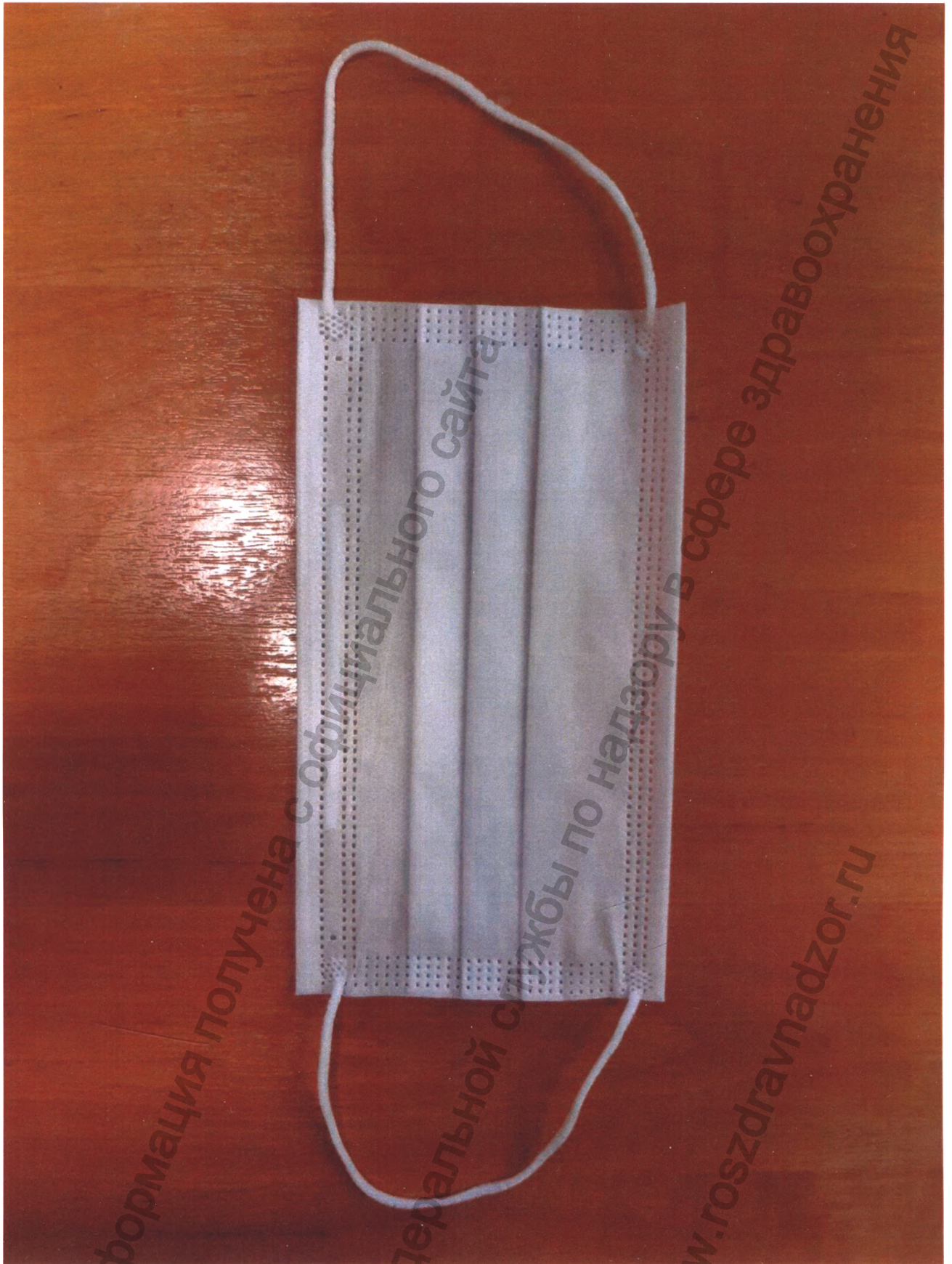
Рисунок 2 – Маска медицинская, одноразовая, трехслойная, из нетканого материала по ТУ 32.50.50-001-45722251-2020. Цвет: белый (натуральный).