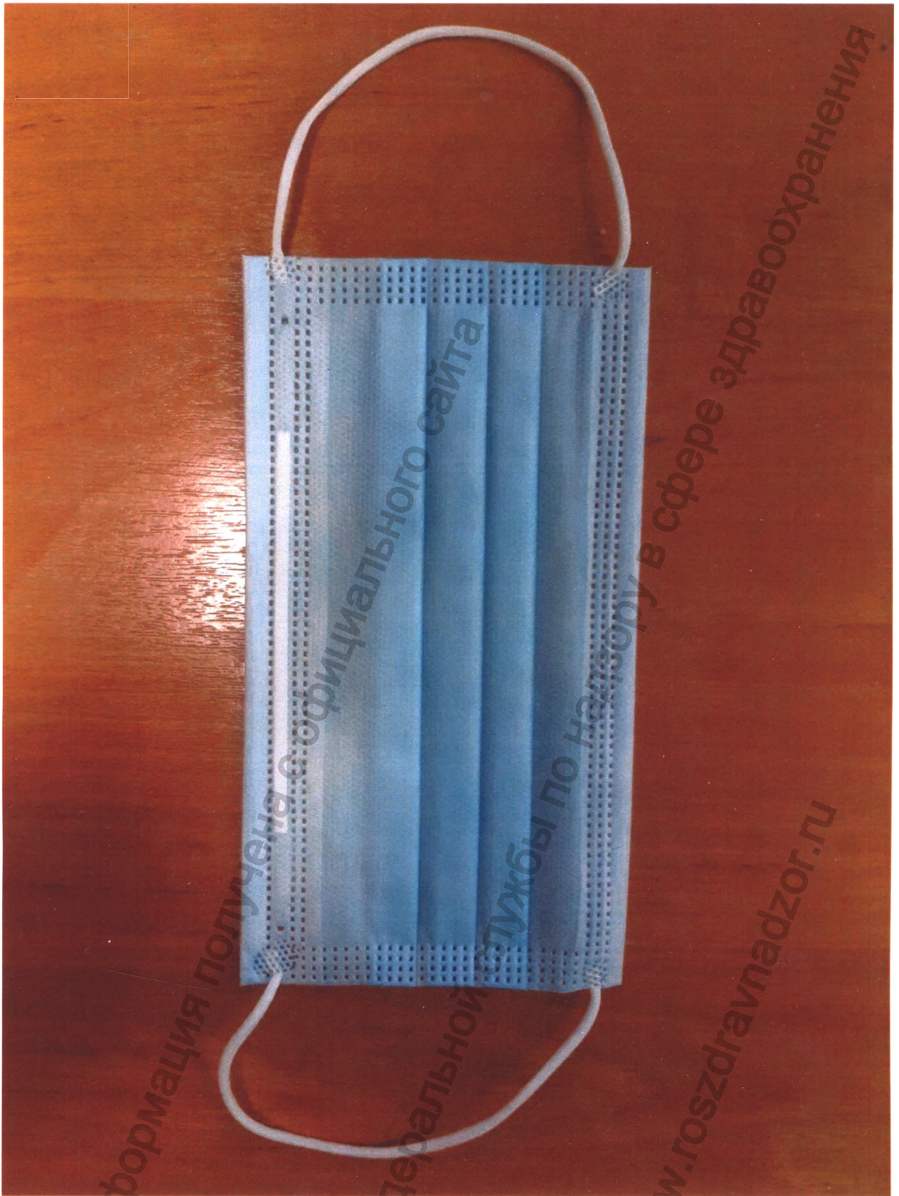
Рисунок 1 – Маска медицинская, одноразовая, трехслойная, из нетканого материала по ТУ 32.50.50-001-45722251-2020. Цвет: голубой.