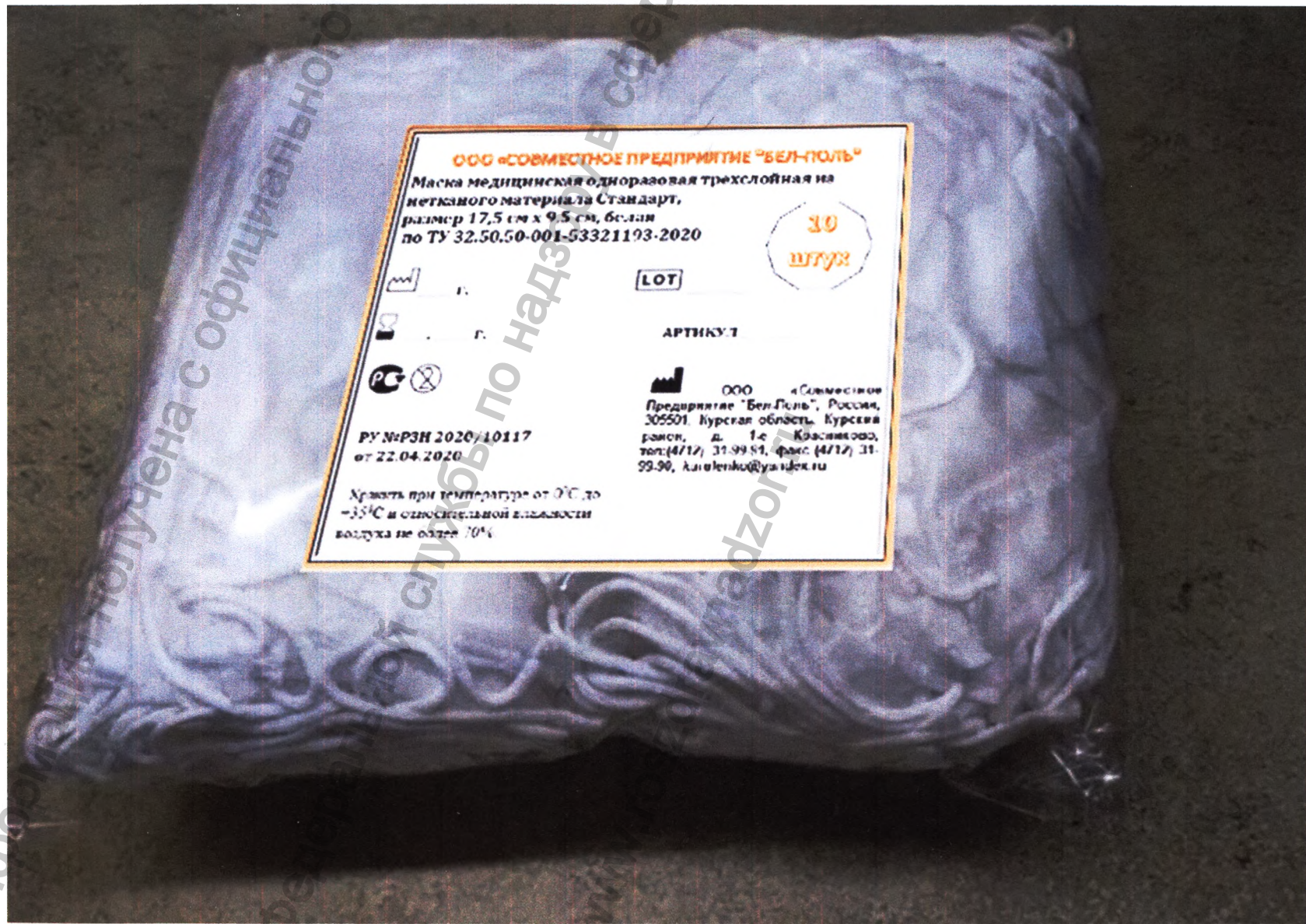
Пример групповой упаковки из пленки