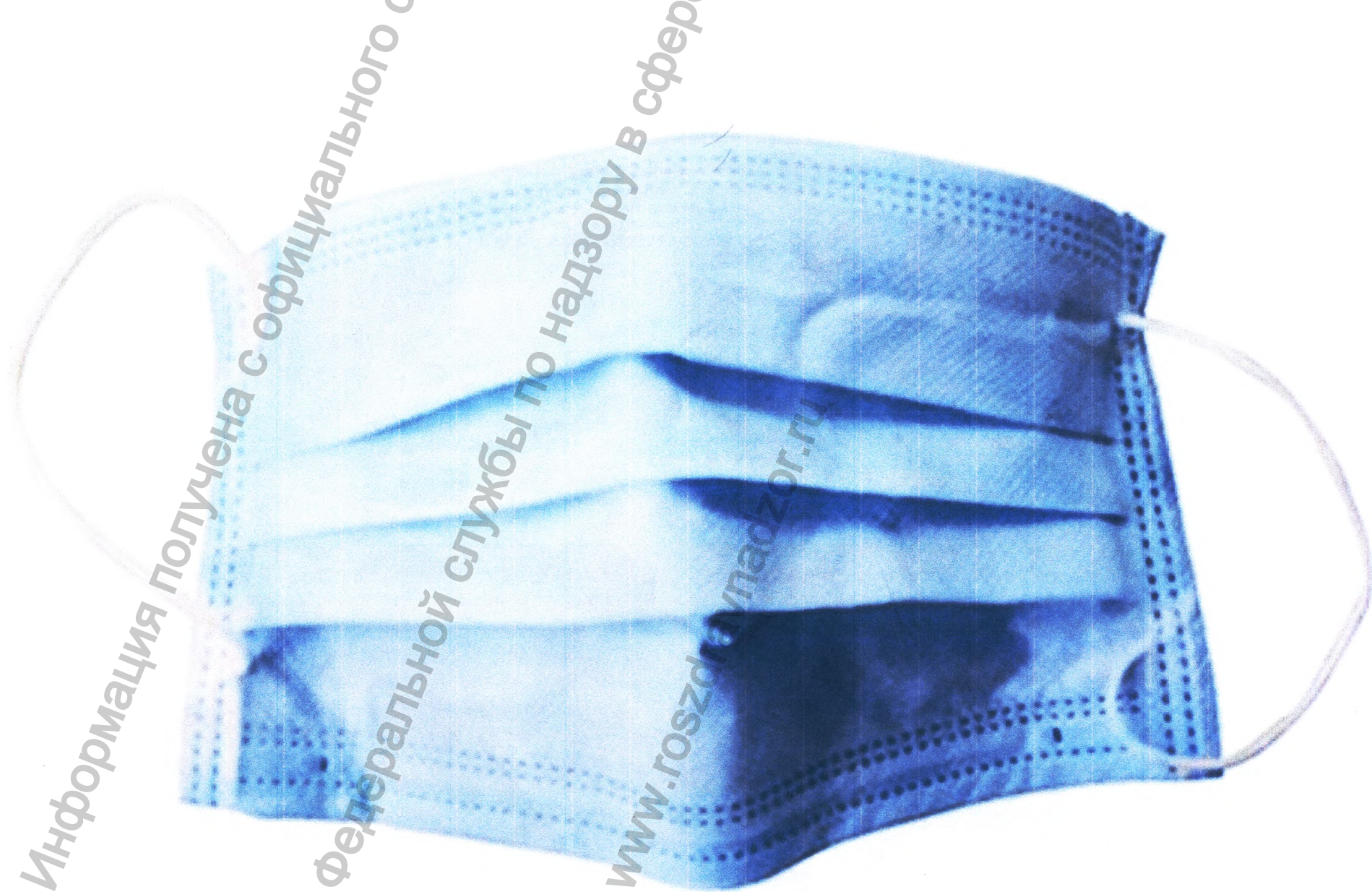
Маска медицинская одноразовая трехслойная из нетканого материала по ТУ 32.50.50-001-53321193-2020, стандарт, голубая, 17,5×9,5 см