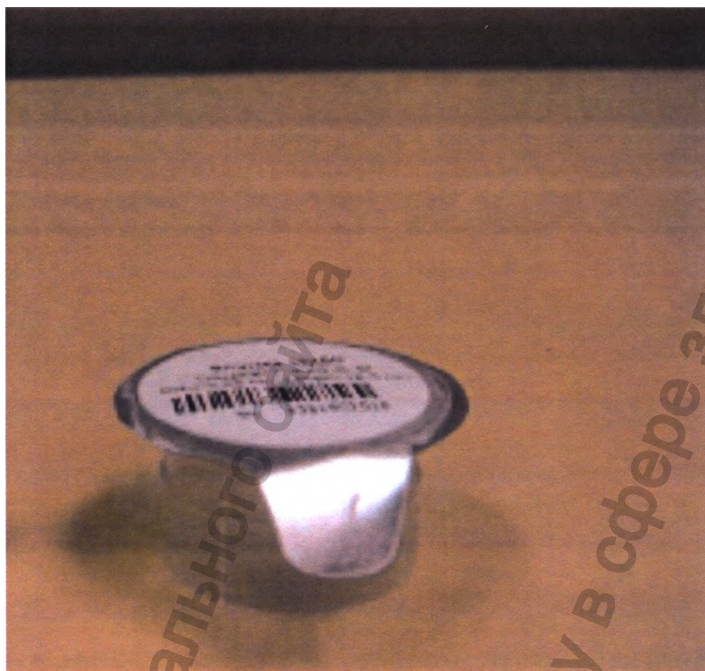
Общий вид флакона пластикового с линзой в держателе в буферном растворе