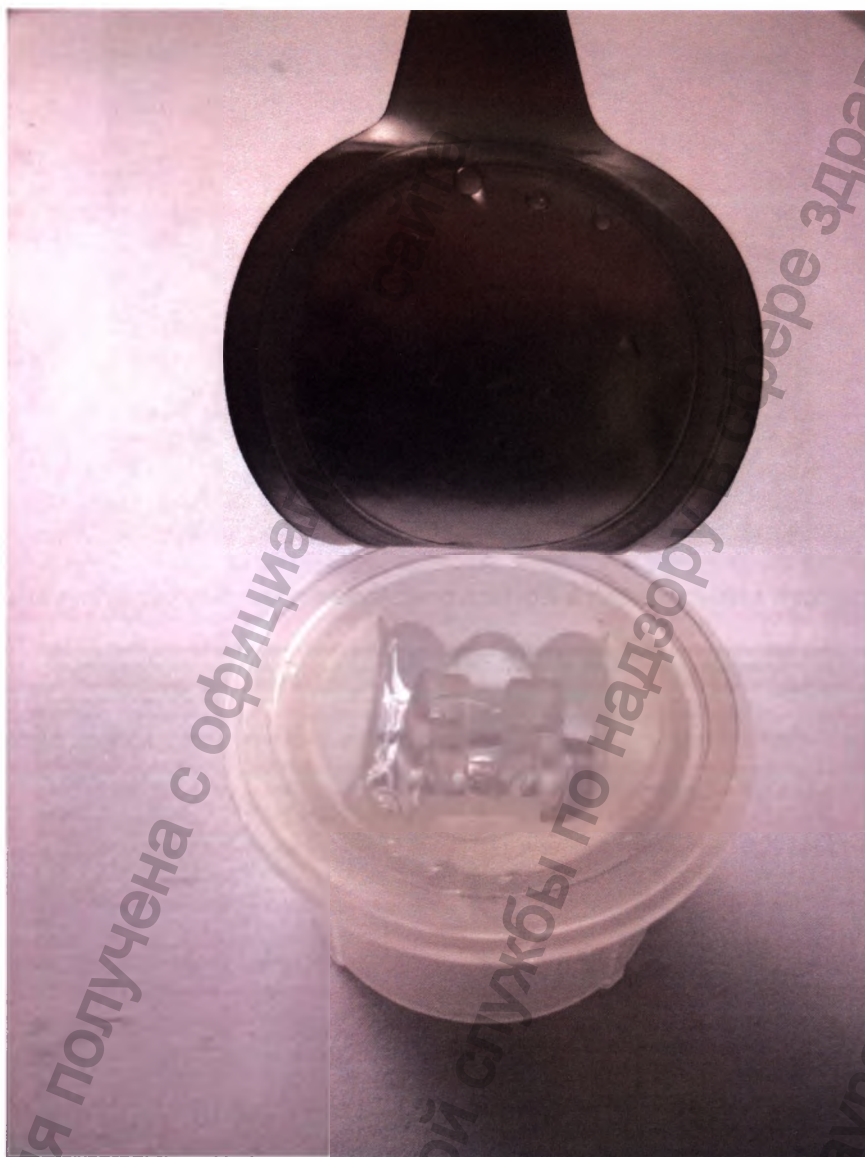
Общий вид линзы интраокулярной для задней камеры глаза псевдофакичной enVista Toric (энВиста Торик) модель MX60T в держателе