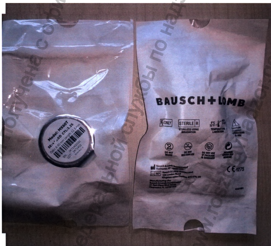
Общий вид потребительской упаковки линзы интраокулярной для задней камеры глаза псевдофакической enVista Toric (энВиста Торик) модель MX60T