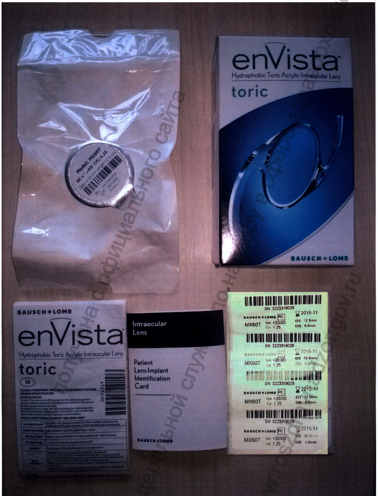
Общий вид комплекта поставки линзы интраокулярной для задней камеры глаза псевдофакичной enVista Toric (энВиста Торик) модель MX60T