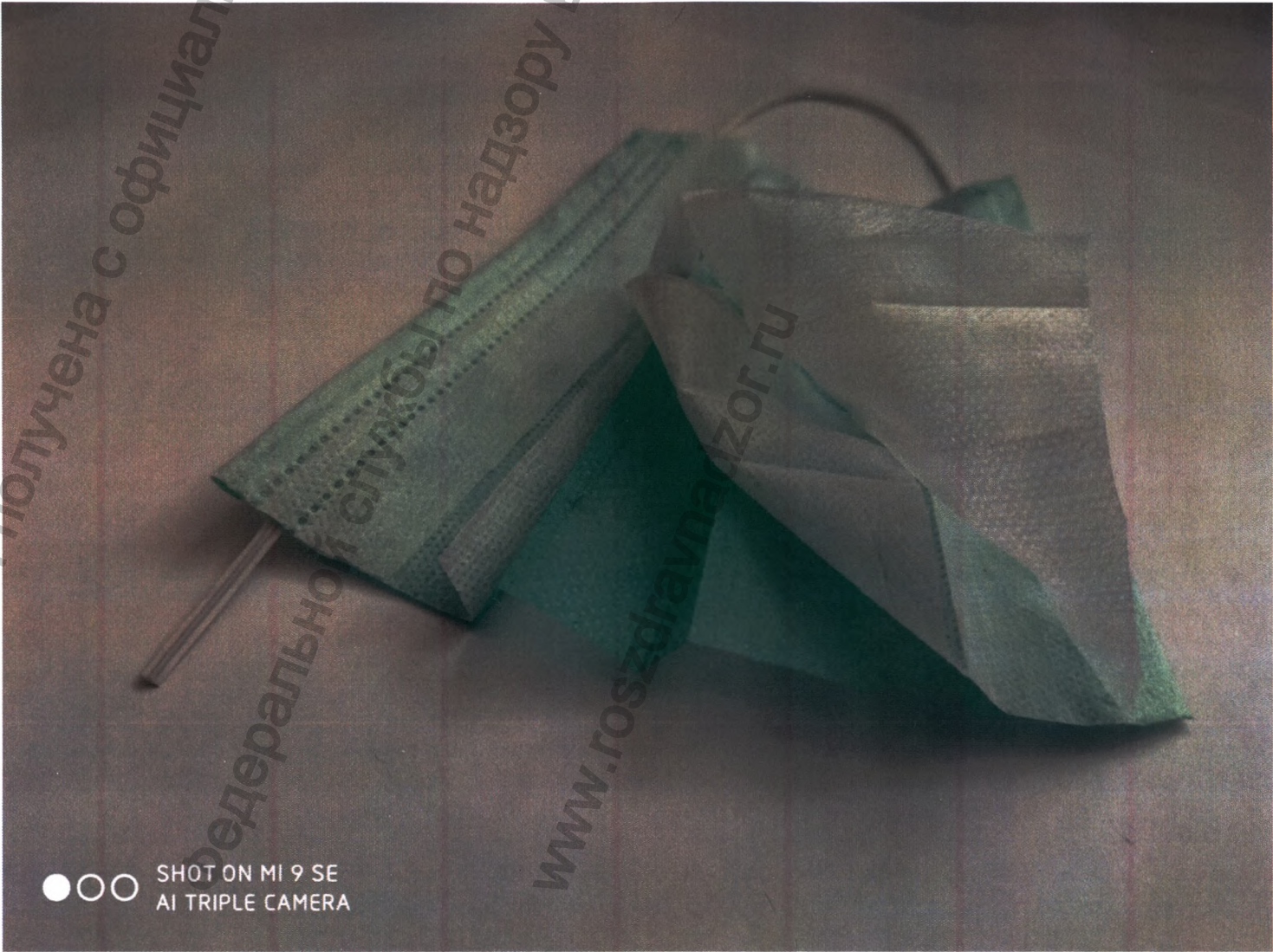
Фото № 10

Информация получена с официального сайта Федеральной службы по надзору в сфере www.goszdrazvna.gov.ru