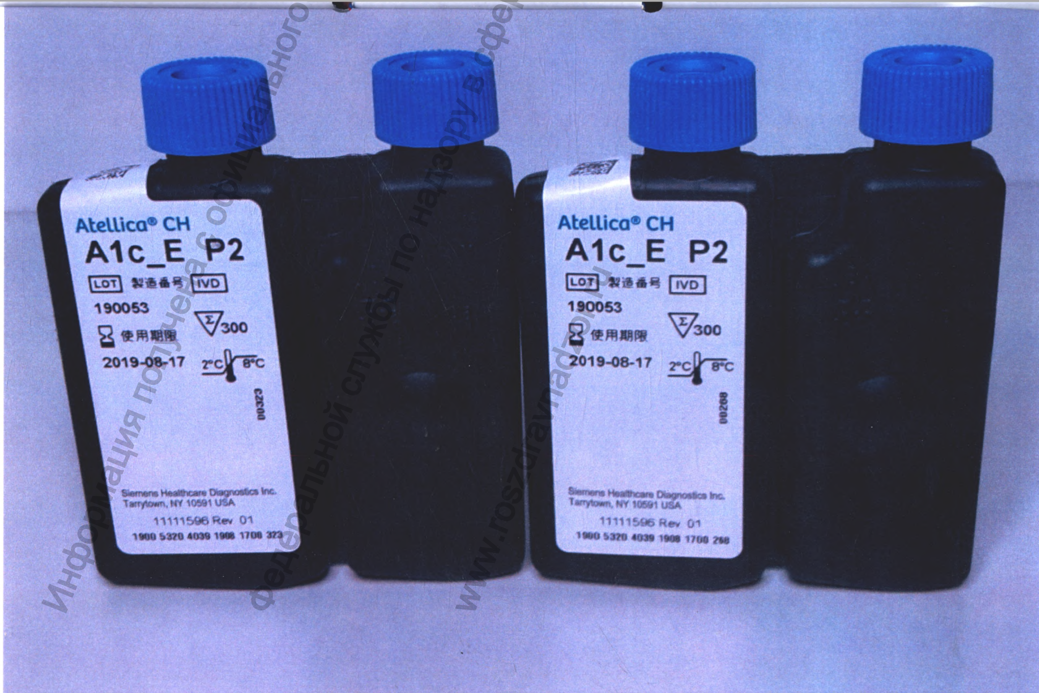
Рисунок 3 Набор реагентов для определения гликозилированного гемоглобина (HbA1c) на анализаторах биохимических серии Atellica (Atellica CH Enzymatic Hemoglobin A1c (Atellica CH A1c_E)): флаконы с реагентами, общий вид, упаковка 2.