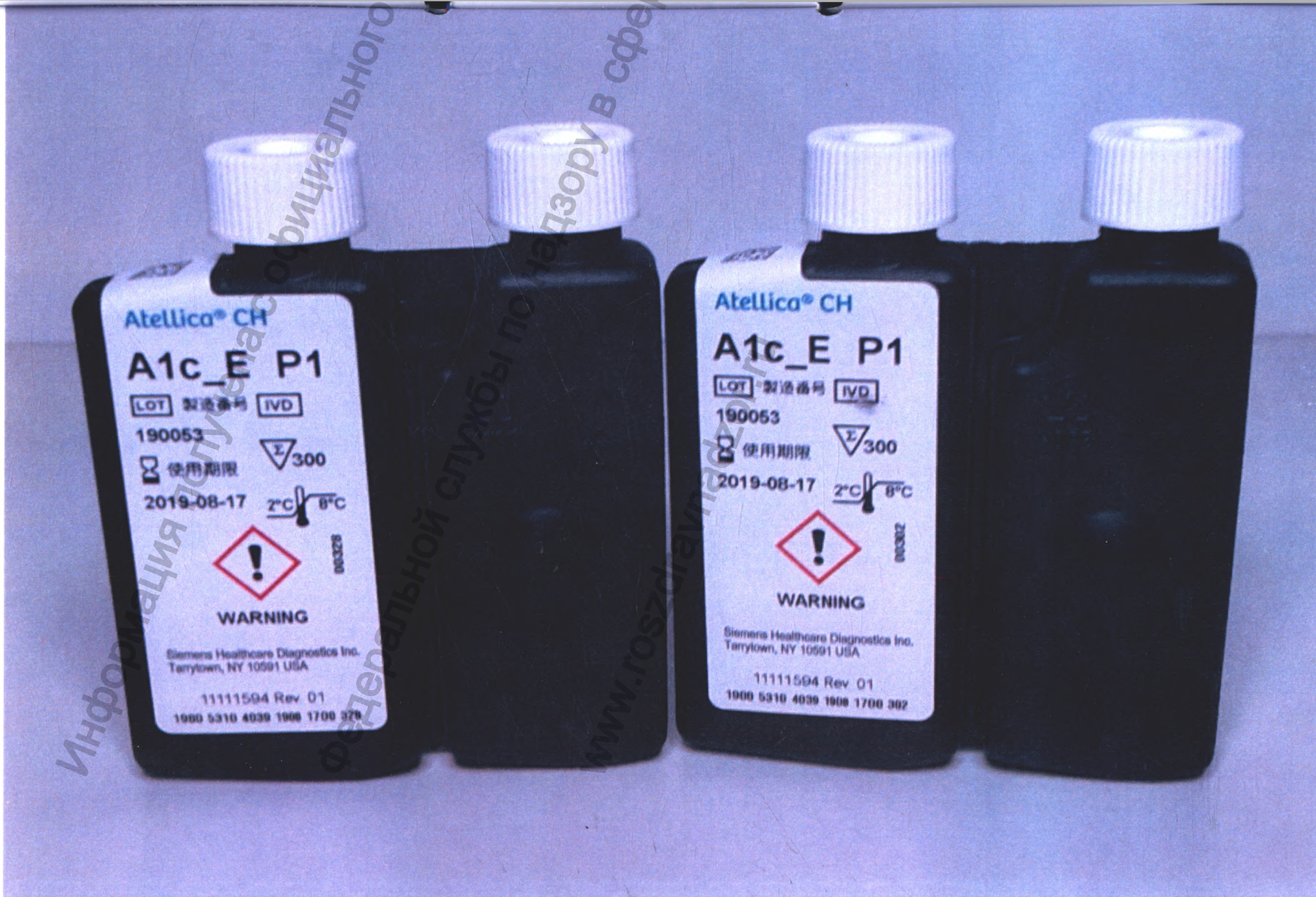
Рисунок 2. Набор реагентов для определения гликозилированного гемоглобина (HbA1c) на анализаторах биохимических серии Atellica (Atellica CH Enzymatic Hemoglobin A1c (Atellica CH A1c_E)): флаконы с реагентами, общий вид, упаковка 1