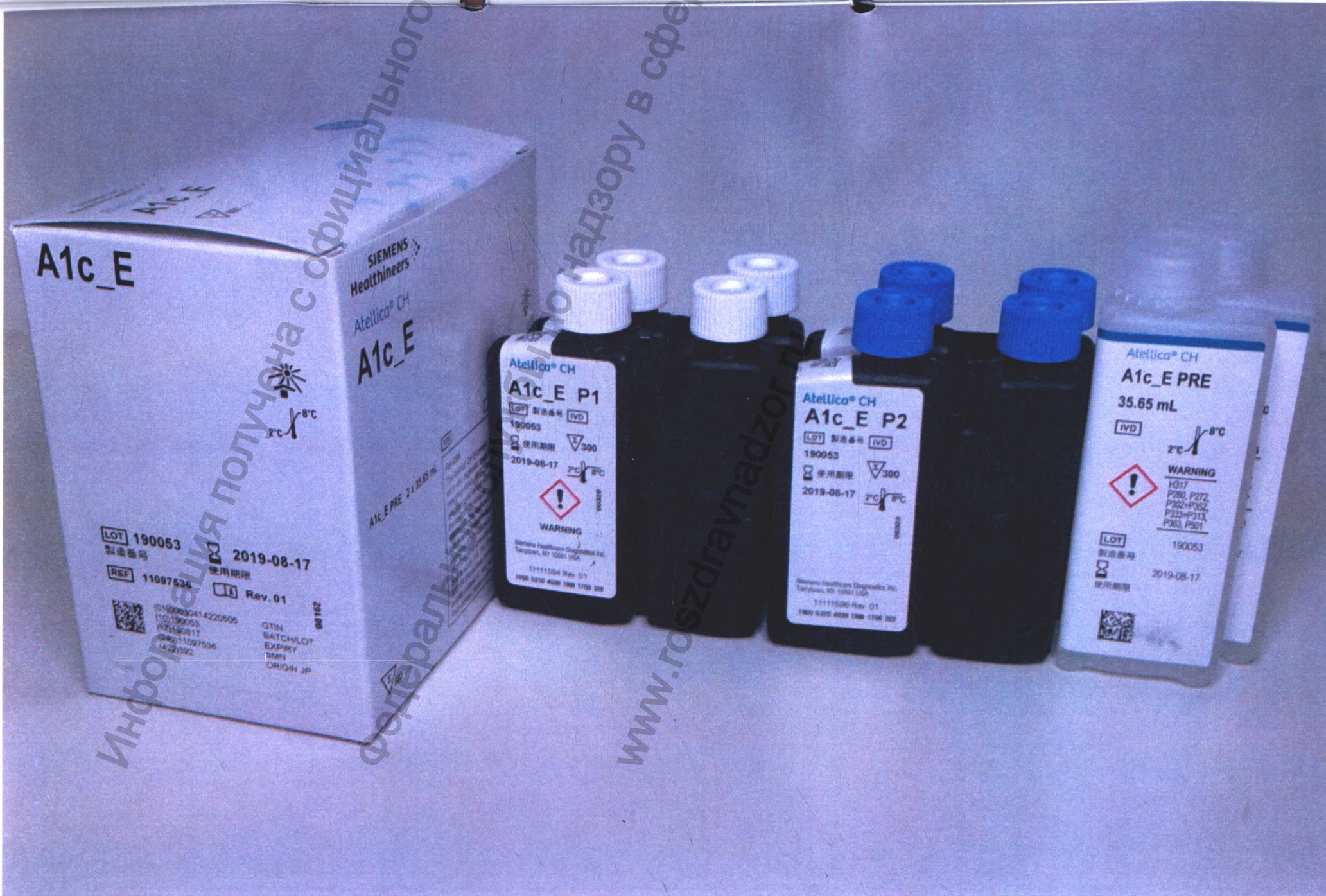
Рисунок 1. Набор реагентов для определения гликозилированного гемоглобина (HbA1c) на анализаторах биохимических серии Atellica (Atellica CH Enzymatic Hemoglobin A1c (Atellica CH A1c_E))