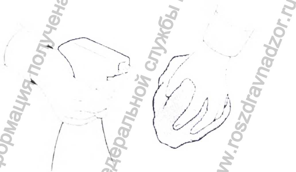
Рисунок 1. Как пользоваться дезинфицирующим аэрозолем.

Процесс чистки: смочить чистую вату или губку раствором перекиси водорода с моющим средством и почистить внешние части штатива.