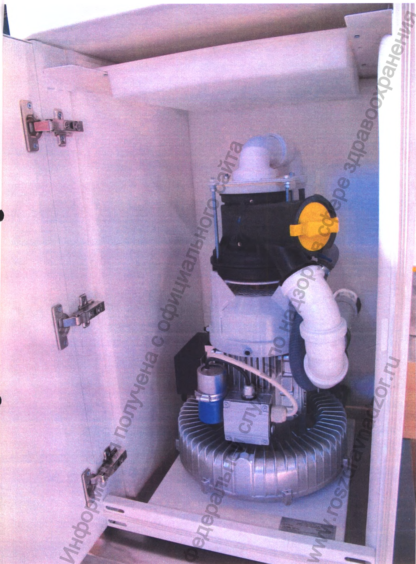
Вид с принадлежностью «Кожух шумопоглощающий»