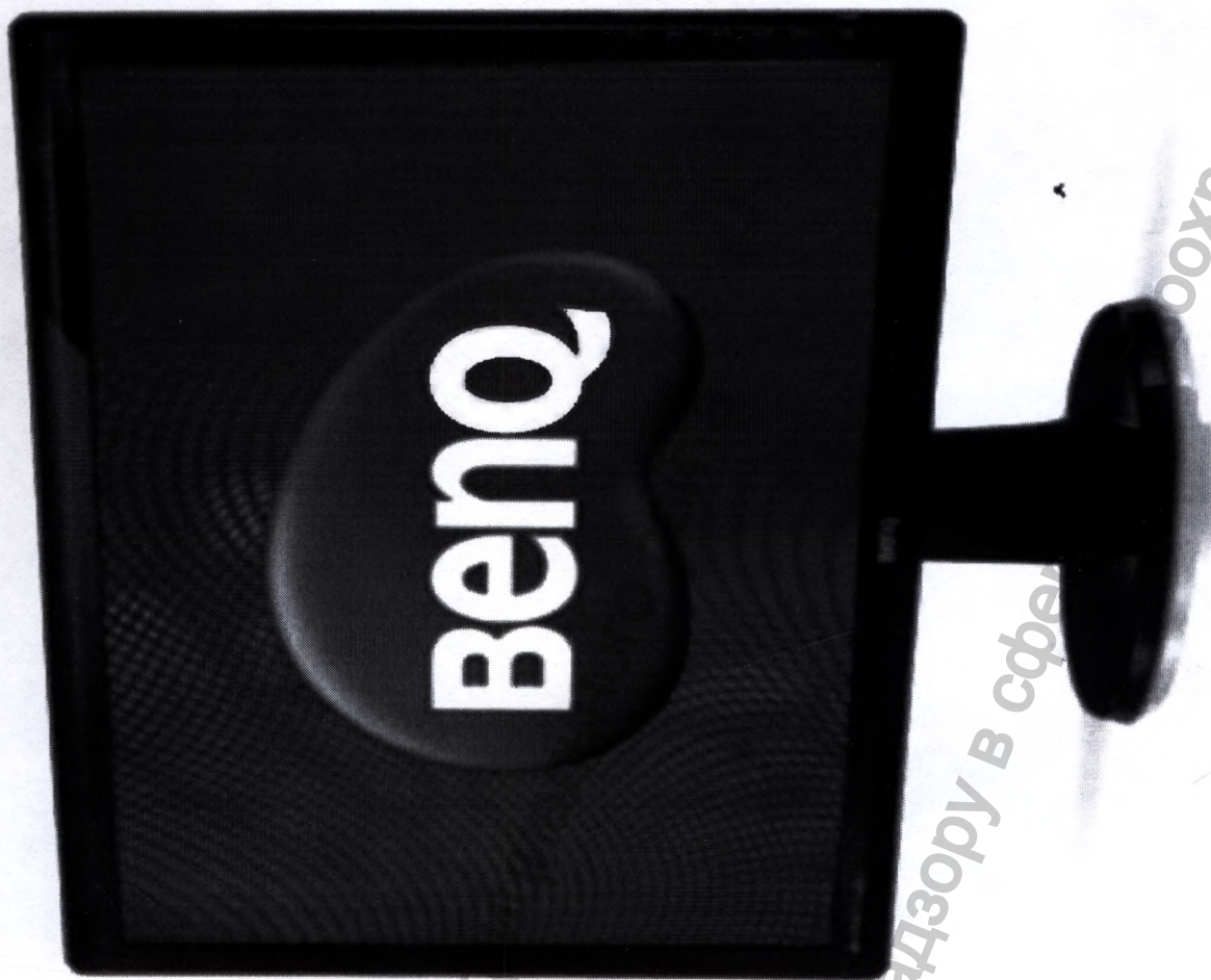
Сенсорный монитор, Контроллер сенсорного стекла.