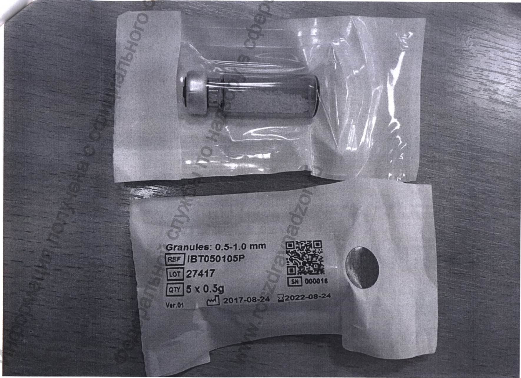
Рис. 2. ImproBone TCP.