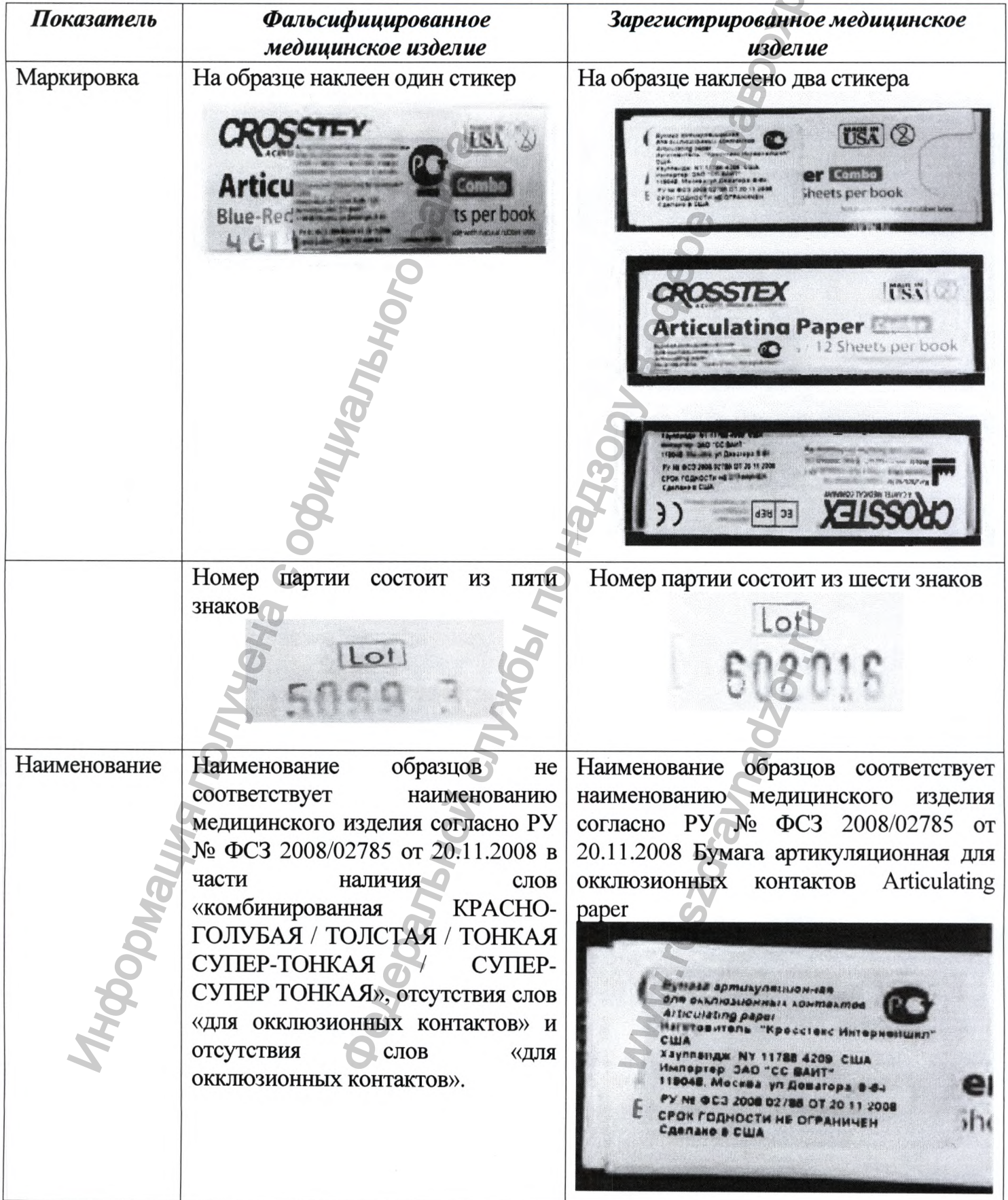
Таблица сравнения идентификационных признаков выявленного медицинского изделия и зарегистрированного медицинского изделия