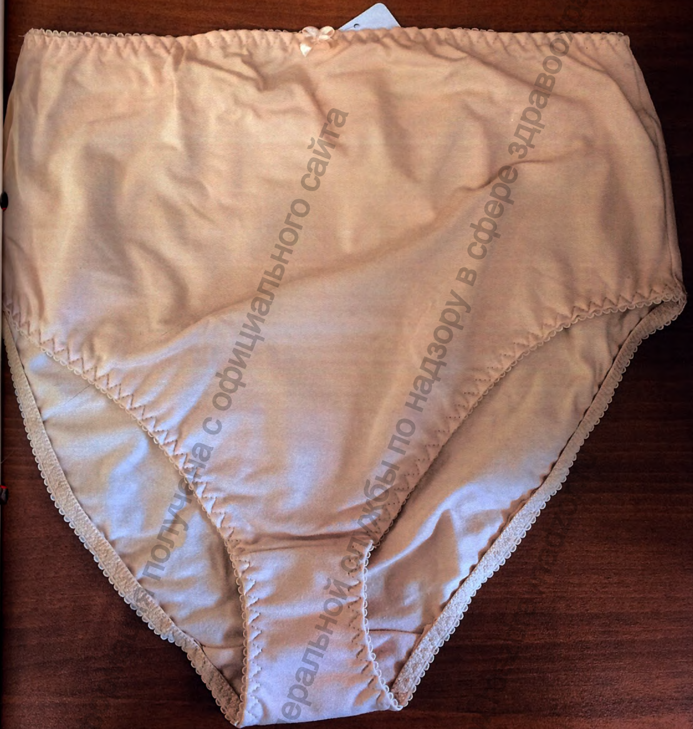
Трусы медицинские эластичные ELAST дородовые

У ФСЗ № 2008/02802 от 11.11.2008 г. Трусы медицинские эластичные ELAST дородовые. Производитель - ООО "ТОНУС ЭЛАСТ", Латвия