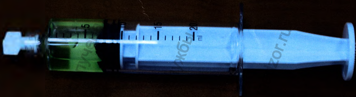
Микросферы для эмболизации LifePearl: общий вид